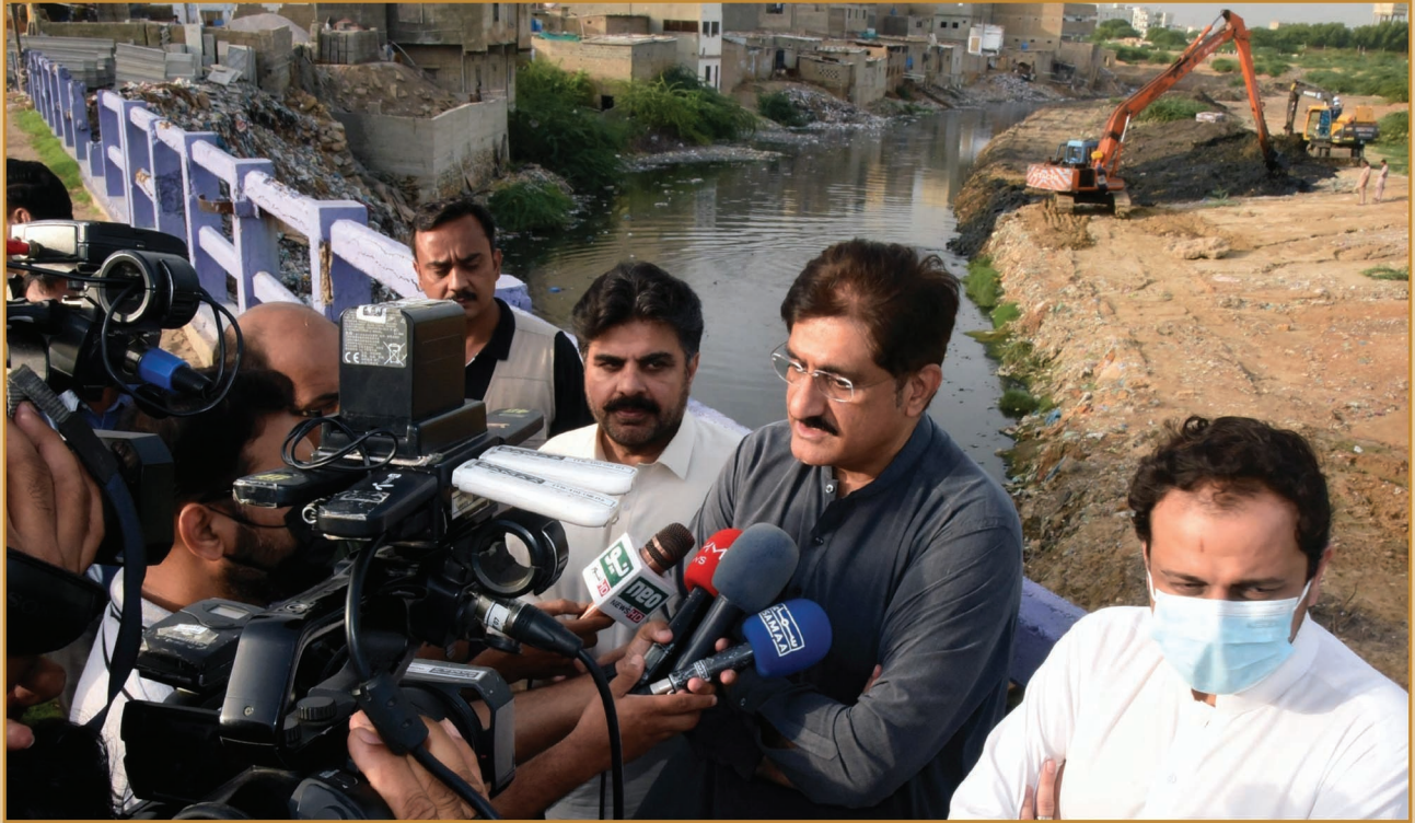
سنڌ جو وڏو وزير سيد مراد علي شاهه چڪوڙا نالو گلستان جوهر ڪراچيءَ ۾ ميڊيا سان ڳالهه ٻوله ڪندي. سائس گڏ بلديات جو وزير سيد ناصر حسين شاهه ۽ ڪراچيءَ جو ايڊمنسٽريٽر مرتضيٰ وهاب پڻ موجود آهن.