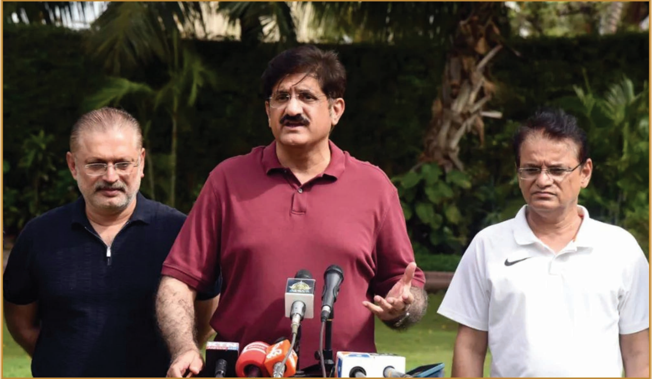
سنڌ جو وڏو وزير سيد مراد علي شاهه وزير اعليٰ هاتوس ۾ ڪراچي ۾ برسات جي هنگامي صورتحال بابت ميڊيا کي پريڻنگ ڏيندي، سائس گڏ اطلاعات کاتي جو وزير شرجيل انعام ميمڻ ۽ چيف سيڪريٽري سنڌ ڊاڪٽر محمد سهيل راجپوت پڻ موجود آهن.