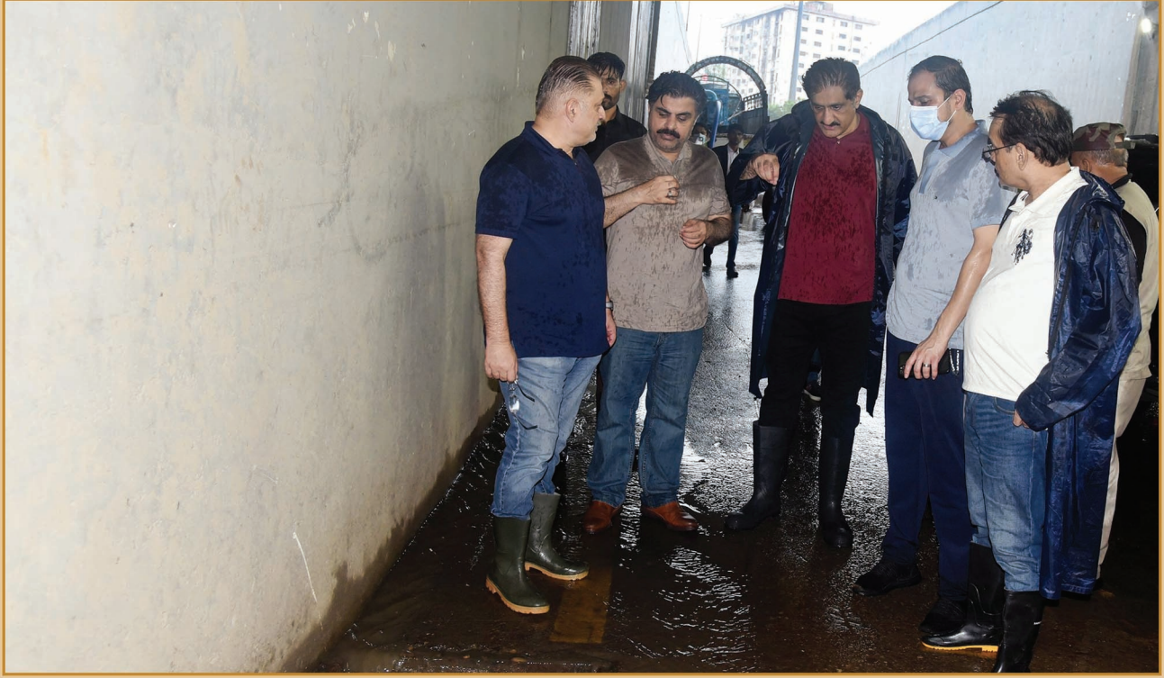
سنڌ جو وڏو وزير سيد مراد علي شاهه سب ميرين انڊر پاس (ڪراچي) ۾ برسات جي پاڻيءَ کي نيڪال ڪرڻ جي نظام جو معائنو ڪندي سائس گڏ صوبائي وزير سيد ناصر حسين شاهه، شرجيل انعام ميمڻ، مرتضيٰ وهاب ۽ چيف سيڪريٽري سنڌ پڻ موجود آهن.