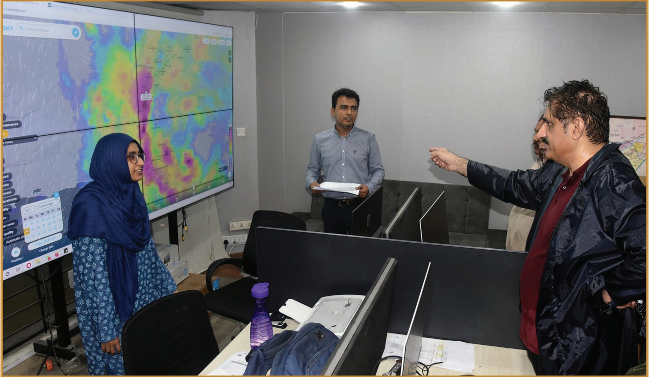
سنڌ جو وڏو وزير سيد مراد علي شاهه صوبائي ڊزاسٽر مئنيجمينٽ اتار تي سنڌ ۾ لڳل برسات جي نگرانيءَ جي نظام جو دورو ڪندي.