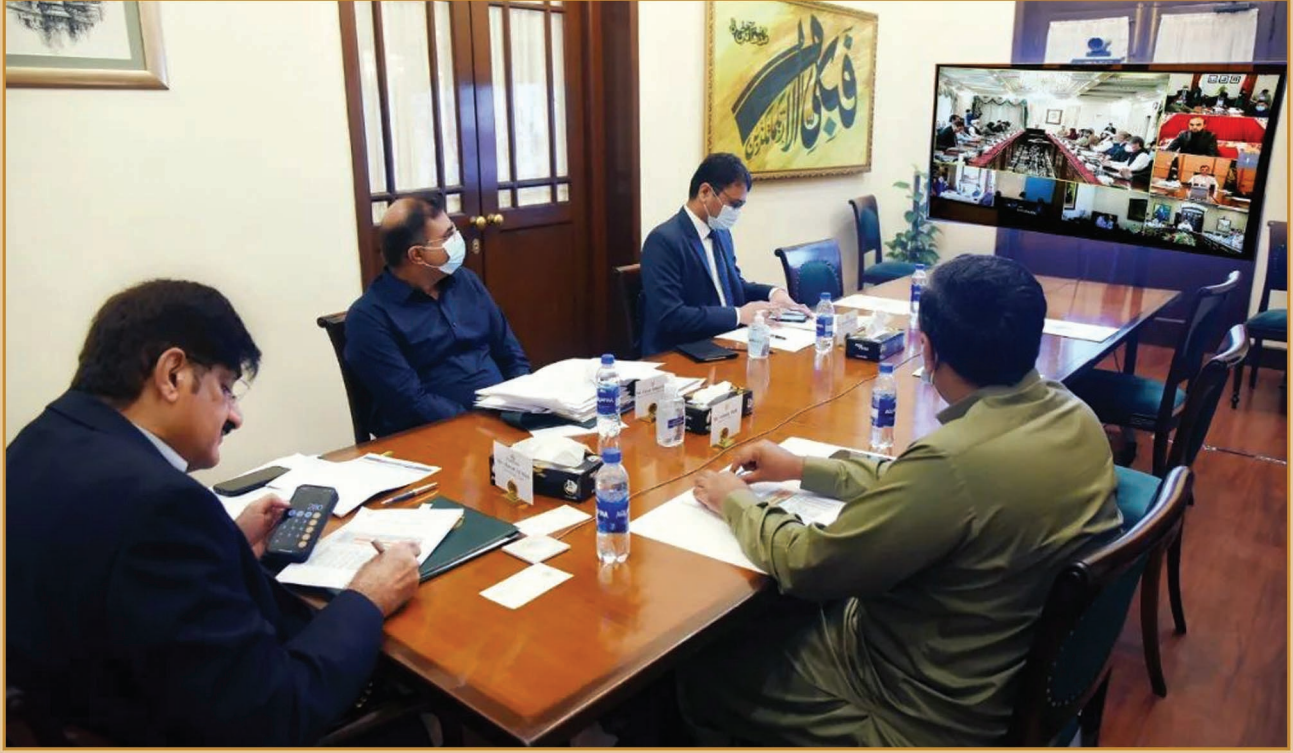
سنڌ جو وڏو وزير سيد مراد علي شاهه وزير اعليٰ هائوس ۾ ويڊيولنڪ وسيلي اسلام آباد ۾ هلندڙ چوماسي جي پرسانن جي نقصانن جو جائزو وٺڻ لاءِ اسلام آباد ۾ وزير اعظم شهباز شريف جي صدارت هيٺ اجلاس ۾ شرڪت ڪندي.