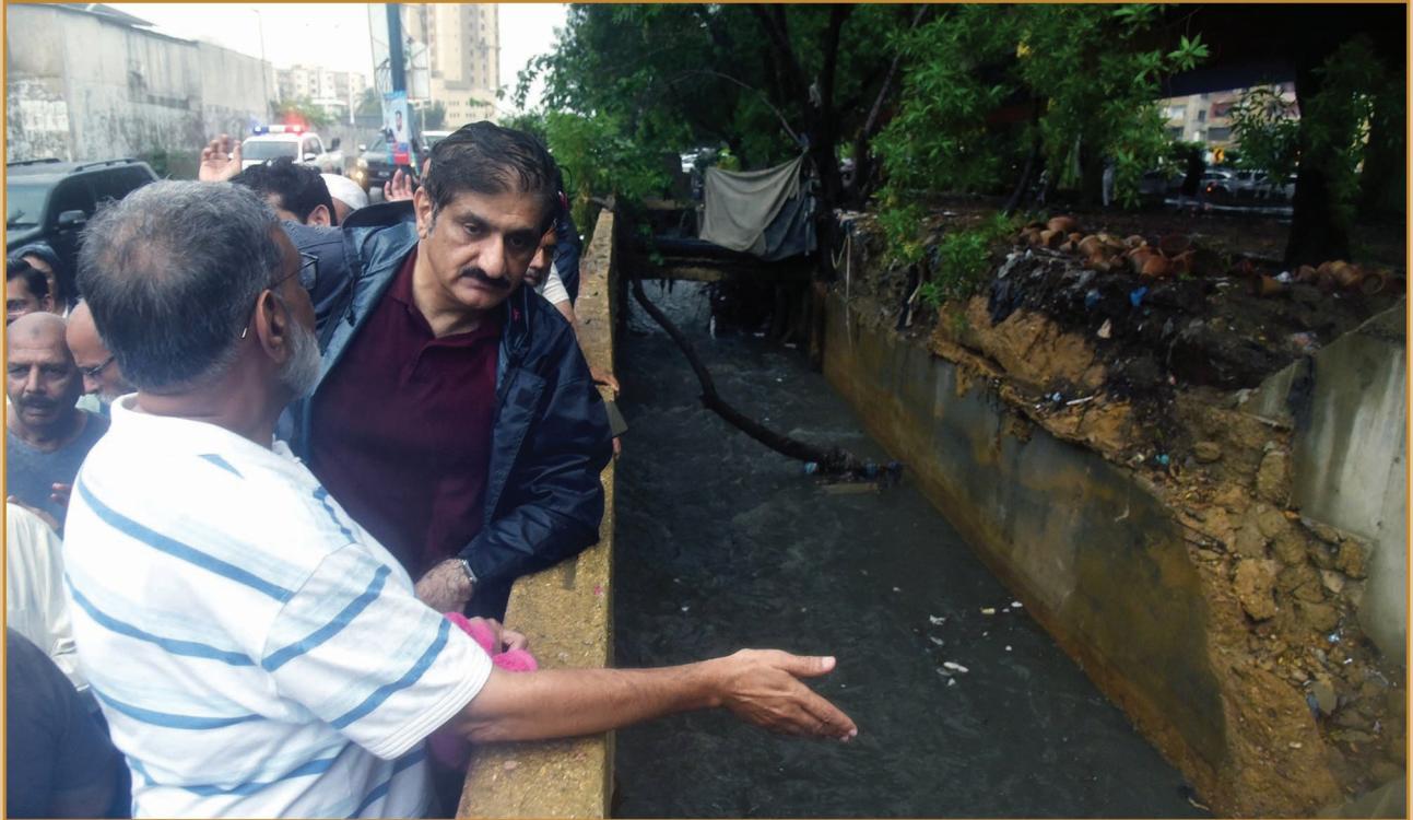
سنڌ جو وڏو وزير سيد مراد علي شاهه گلشن ظفر (ڪراچي) جي علائقي ۾ طوفاني برسات جي پاڻيءَ جي نيڪال جو جائزو وٺندي.