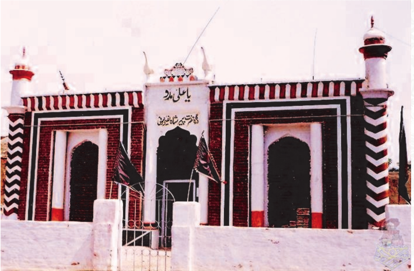
درگاه شاه نصير - نوشهروفيروز

نوشهروفيروز سنڌ جو قديمي شهر آهي. هن شهر جو ذڪر سنڌ جي قديمي ڪتابن ۾ ڪيو ويو آهي، جيئن گزيتيئر ۾ پڻ ان جو ذڪر ملي ٿو. نالي جو پس منظر اهو ٻڌايو وڃي ٿو ته هي شهر 9 دفعا اجڙيو ۽ 9 دفعا