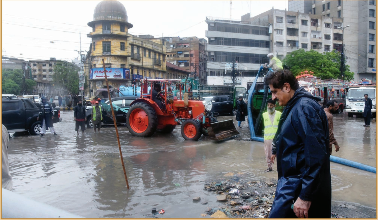
سنڌ جو وڏو وزير سيد مراد علي شاهه برسات جي پاڻيءَ جي مناسب نيڪال جي انتظامن جو معائنو ڪرڻ لاءِ تاورايريا (ڪراچي) جو دورو ڪندي.