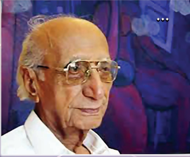
سنت جو عظيم اديب ۽ ڏاهو محمد ابراهيم جويو