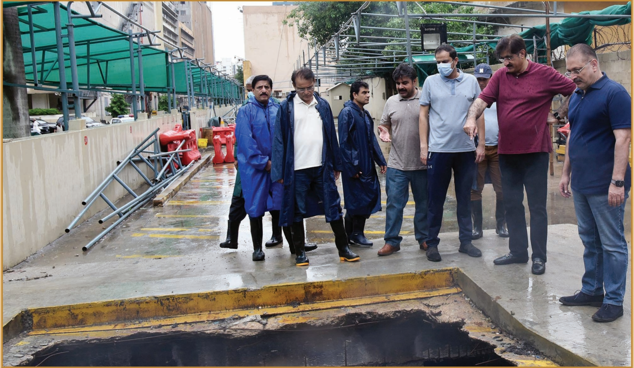
سنڌ جو وڏو وزير سيد مراد علي شاهه سنڌ مدرسي اسڪول جي پٺيان موجود استرم واٽر ڊرين ۾ پاڻيءَ جو وهڪرو ڏسندي. سائس گڏ صوبائي وزير سيد ناصر حسين شاهه، شرجيل انعام ميمڻ، مرتضيٰ وهاب ۽ چيف سيڪريٽري سنڌ پڻ موجود آهن.