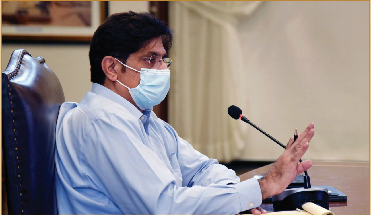
سنڌ جو وڏو وزير سيد مراد علي شاهه ايف بي سي سي آءِ جي انتظام هيٺ پنهنجي گهر ڪلفتن ۾ ڪراچيءَ جي عوام جي ڪاروباري ترقي، واپار ۽ خوشحاليءَ لاءِ شهر ۽ علائقائي رٿابنديءَ جي اهميت جي موضوع تي سيمينار کي خطاب ڪندي.