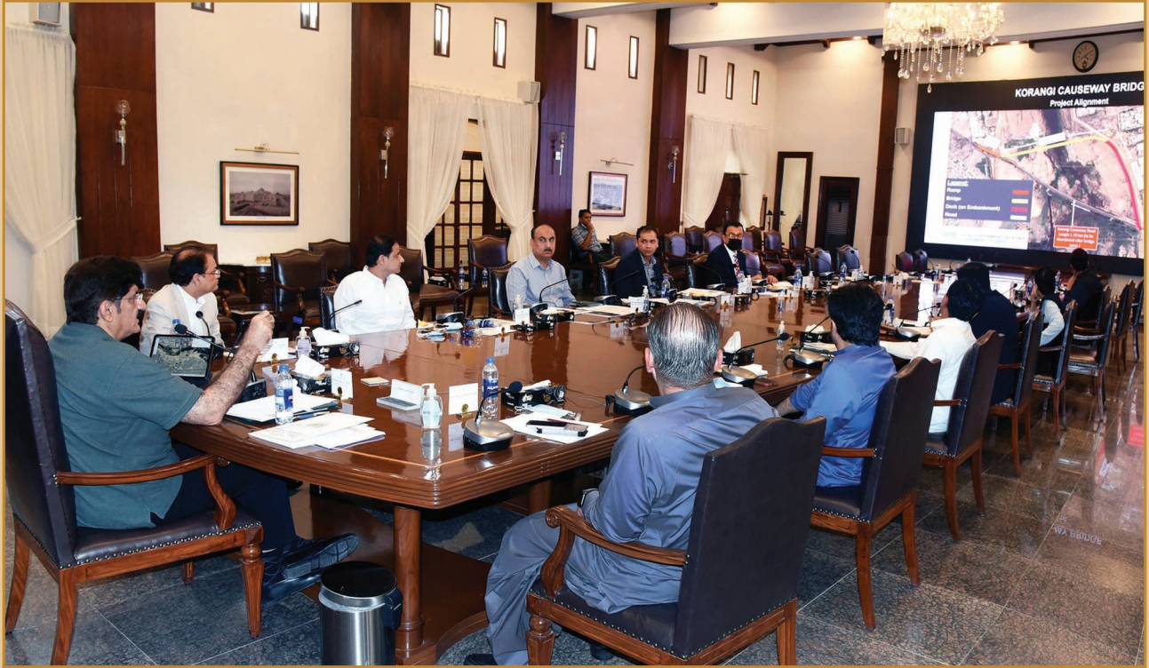
سنڌ جو وڏو وزير سيد مراد علي شاهه وزير اعليٰ هائوس ۾ ڪراچيءَ لاءِ ڪجهه نون منصوبن کي آخري شڪل ڏيڻ لاءِ اجلاس جي صدارت ڪندي.