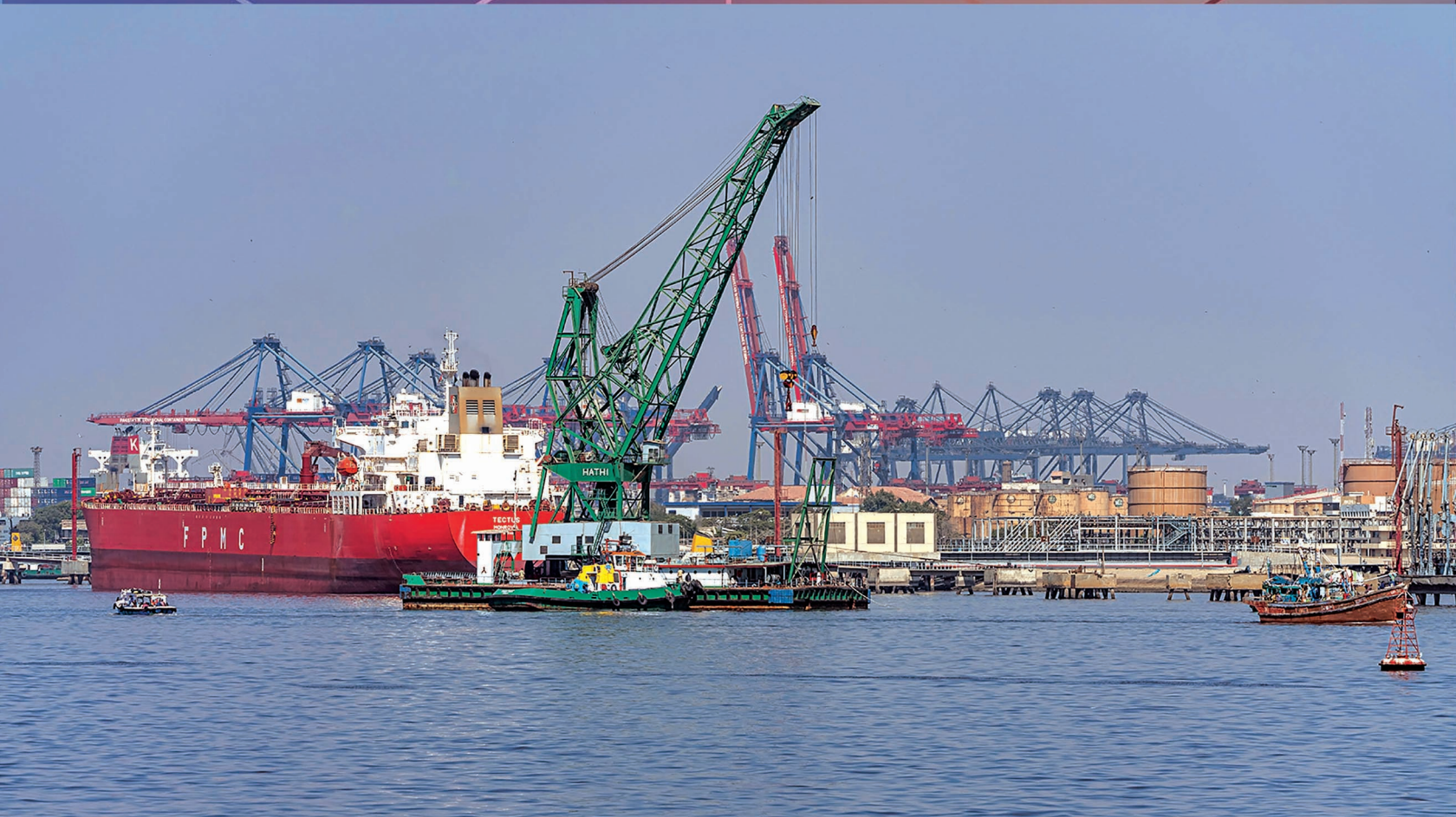
ڪراچي بندرگاه جي ڪهاڻي