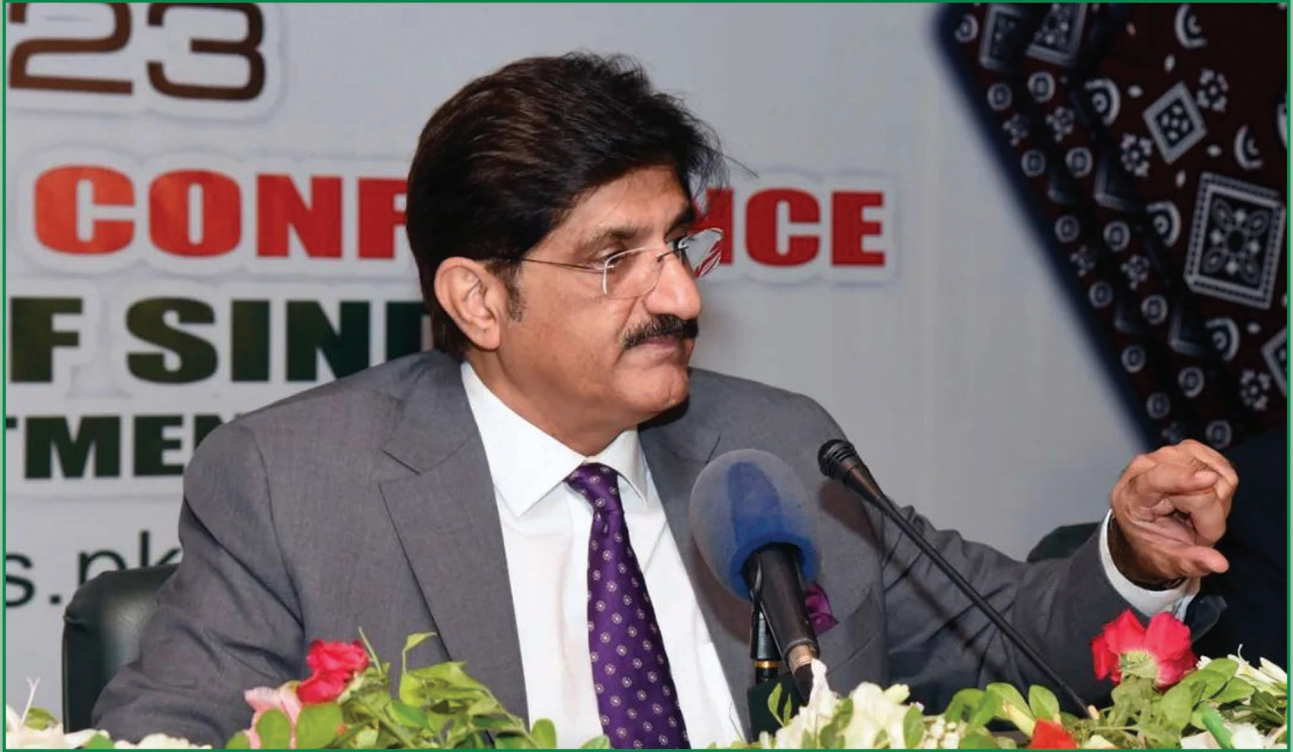
سنڌ جو وڏو وزير سيد مراد علي شاهه سنڌ اسيمبليءَ ۾ پوسٽ بجيٽ پريس ڪانفرنس ڪندي.