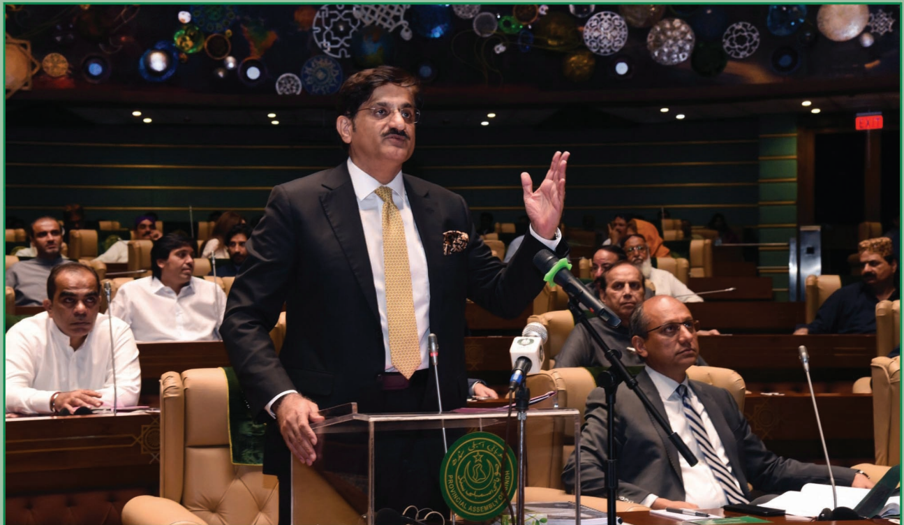
سنڌ جو وڏو وزير سيد مراد علي شاهه صوبائي اسيمبليءَ ۾ سالياني بجيت پيش ڪندي.