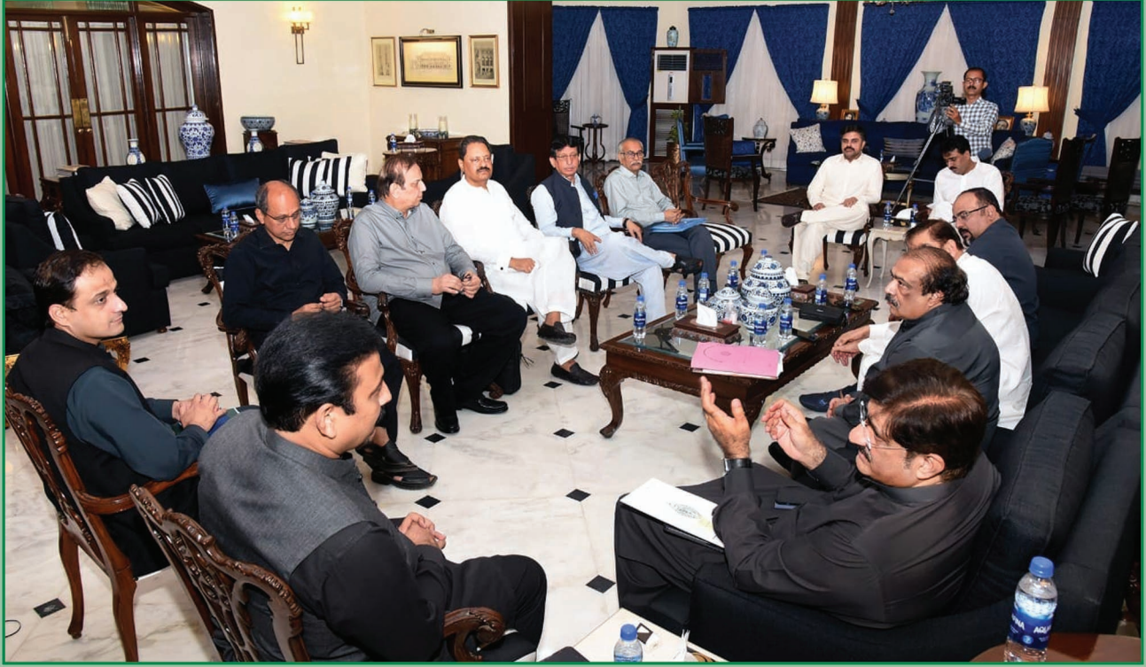
سنڌ جو وڏو وزير سيد مراد علي شاهه وزير اعليٰ هائوس ۾ ڪنور نويد جميل جي قيادت ۾ ايمر ڪيو ايمر جي وفد سان ملاقات ڪندي