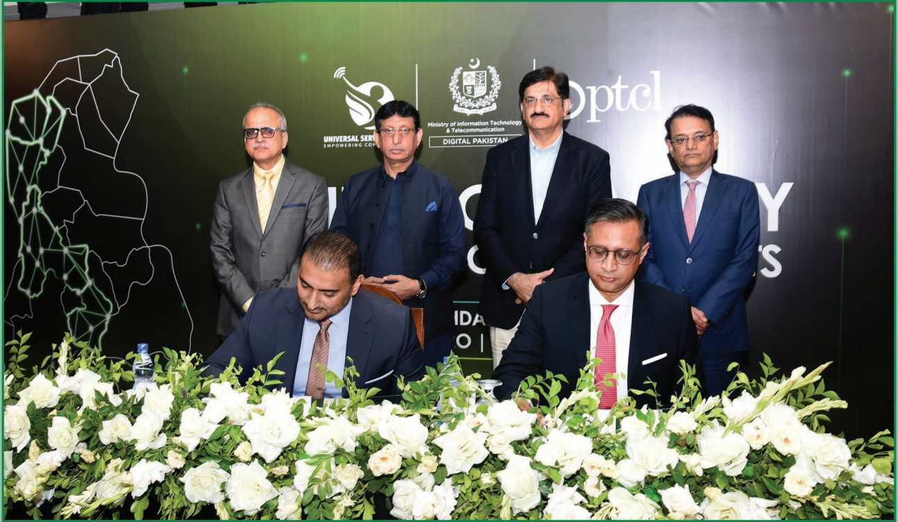
سنڌ جو وڏو وزير سيد مراد علي شاهه، وفاقي وزير آءِ ٽي سيد امين الحق، سنڌ جو چيف سيڪريٽري سهيل راجپوت ۽ وفاقي ايڊيشنل سيڪريٽري آءِ ٽي محسن مشتاق صوبي ۾ آپٽڪ فائبر ڪيبل وڇائڻ لاءِ پي ٽي سي ٽي ۽ يونيورسل سروس فنڊ وچ ۾ صحيحن جي تقريب جي موقعي تي موجود آهن.