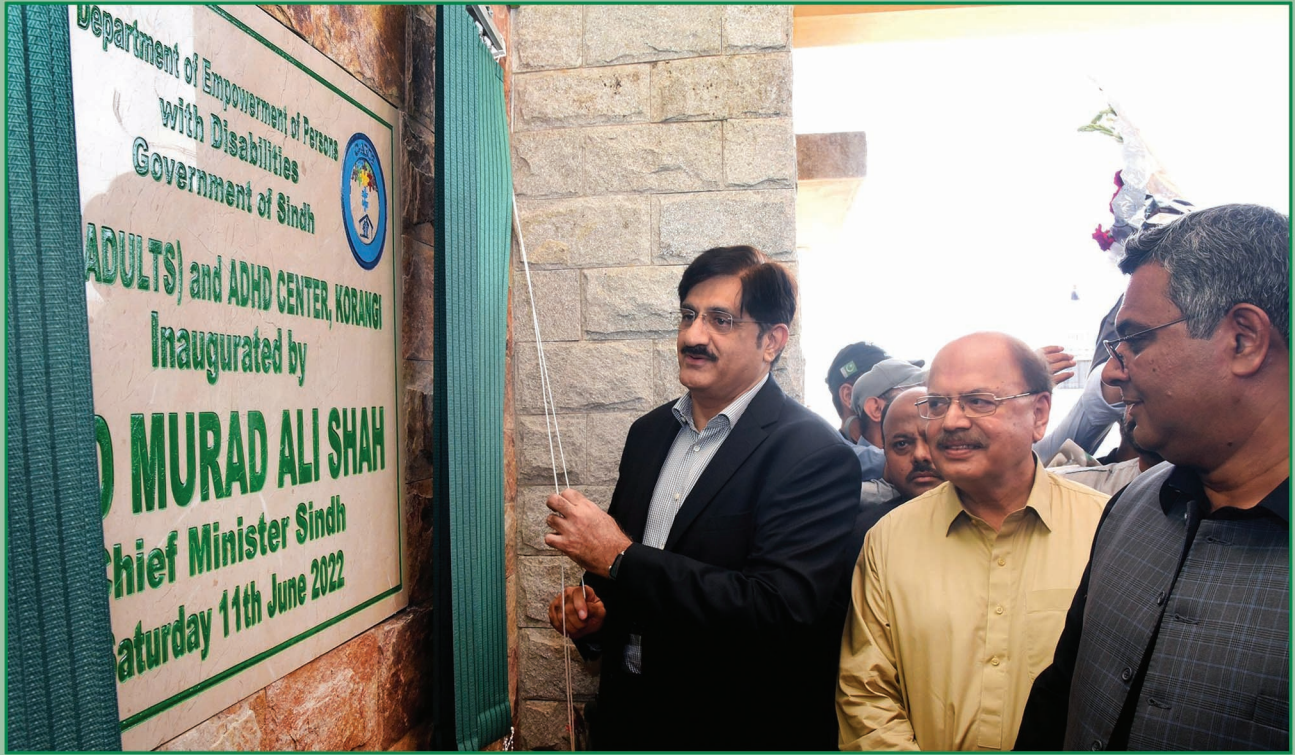
سنڌ جو وڏو وزير سيد مراد علي شاهه ڪورنگي (ڪراچي) ۾ سينٽر فار آٽزمري هيبليٽيشن اينڊ ٽريننگ (C-ART) ٽيان جي گهٽتائيءَ جي هائپر ايڪٽيويٽي ڊس آرڊر (ADHD) جي افتتاح لاءِ تختيءَ جي نقاب ڪشائي ڪندي وزير اعليٰ جو صلاحڪار منظور حسين وساڻ ۽ خاص معاون صادق ميمڻ پڻ ساڻس گڏ بيٺل آهن.