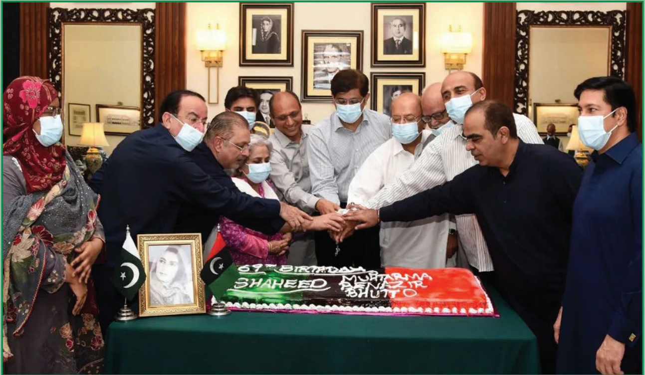
سنڌ جو وڏو وزير سيد مراد علي شاهه وزير اعليٰ هاڻوس ۾ پنهنجي ڪابينا جي ميمبرن سان گڏ شهيد محترم بينظير ڀٽو جي 69 هين سالگره ملهائڻ لاءِ ڪيڪ کڻندي