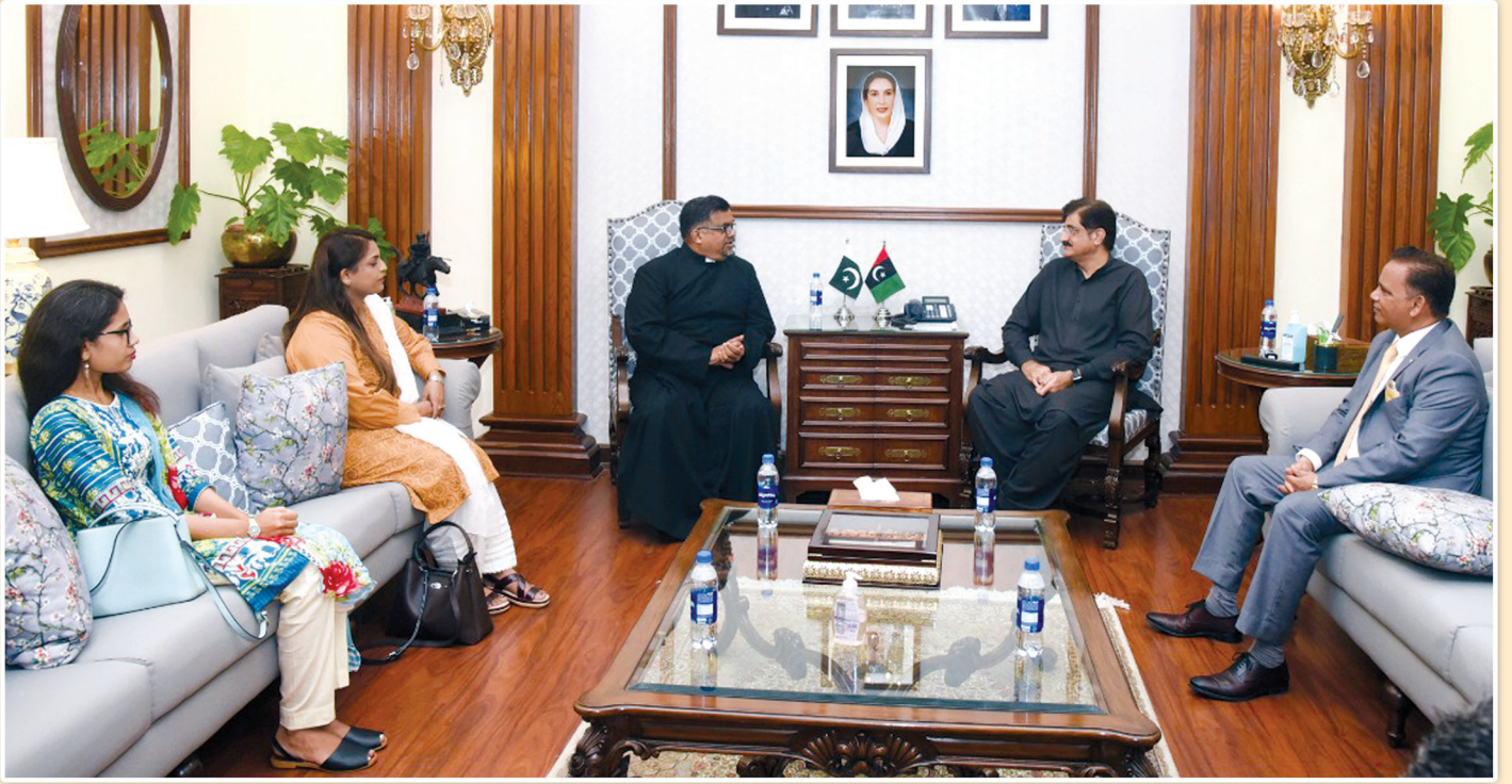
وزیر اعلیٰ سندھ سید مراد علی شاہ سے کیتھولک بورڈ آف ایجوکیشن کا وفد فادر ماریو کی قیادت میں ملاقات کر رہا ہے۔