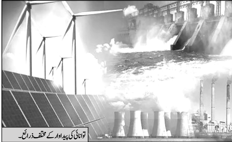
توانائی کی پیداوار کے مختلف ذرائع۔

اگر دیکھا جائے تو وفاقی حکومت یہ تسلیم کرتی ہے کہ پاکستان میں بجلی کے بحران کی وجہ سے سالانہ جی ڈی پی کا تین فیصد حصہ ضائع ہو جاتا ہے۔ اگر اس رقم کو بجلی پیدا کرنے کے متبادل ذرائع پر خرچ کیا جائے تو بجلی کا بحران