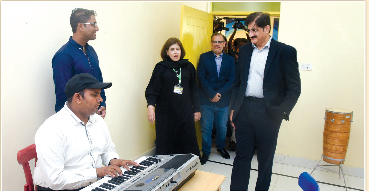
وزیر اعلیٰ سندھ سید مراد علی شاہ، کراچی کے علاقے کورنگی میں تعمیر کئے گئے آئزم ری پبلیکیشن سینٹر کے دورے کے موقع پر کلاس روم کا معائنہ کر رہے ہیں۔