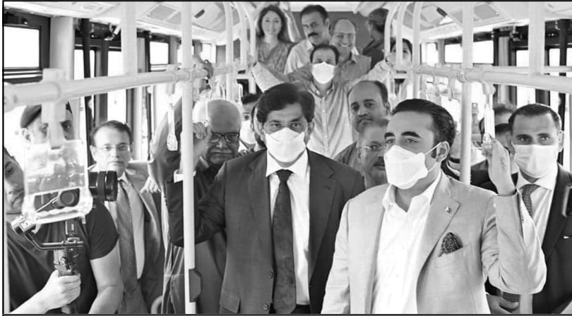
چيئرمين بلاول ڀٽو زرداري، وڏو وزير ۽ سنڌ ڪابينا جا ميمبر پيپلز بس ۾ سفر ڪري رهيا آهن

آهي، ڇاڪاڻ ته ڪراچي جهڙي ڪاسموپوليٽن شهر کي ڊگهي عرصي کان ان سهولت جو انتظار هو. خانگي شعوبو، جنهن بهترين بسون نه هلائڻ ڪري شهر ۾ ماحولياتي گدلاڻ پيدا ٿي رهي هئي، ان سان گڏ حادثا به معمول بڻيل هئا، ان ڪري سنڌ حڪومت، چين کان ماحول دوست ۽ سستيون بسون خريد ڪيون ته جيئن شهرين کي گهٽ خرچ تي سفري سهولتون فراهم ڪري سگهجن. ڪراچي شهر ۾ peak time تي هڪ ئي وقت 40 کان 50 هزار ماڻهو ڪم ڪار جي سانگي لاءِ صبح کان آفيسن ڏانهن نڪرندا آهن. انڪري ايترن ماڻهن کي هڪ ئي وقت ٽرانسپورٽ جي سهولت فراهم ڪرڻ آسان ڪم ناهي، پر ان جي باوجود سنڌ حڪومت ڪراچي سميت سنڌ جي ٻين شهرن لاءِ پيپلز بس سروس جو پروجيڪٽ شروع