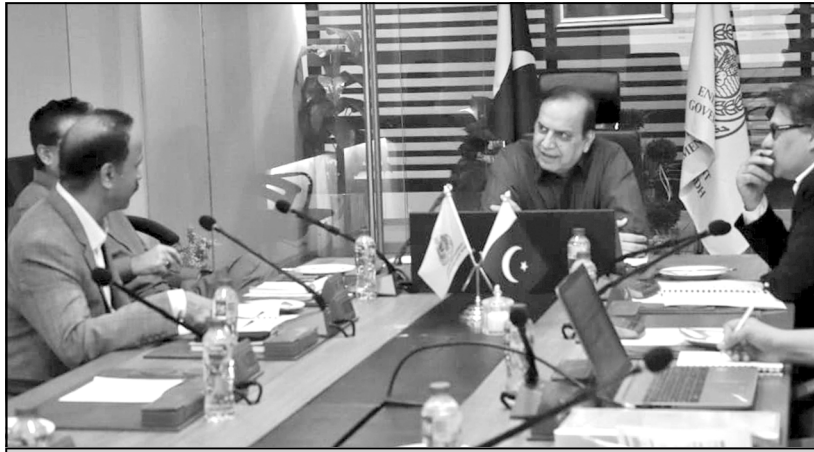
توانائي جي صوبائي وزير جي صدارت هيٺ سنڌ لاکڙا ڪول مائننگ ڪمپني جي گڏجاڻي

بجلي سپلائي ڪرڻ واري ڪمپني کي اليڪٽرڪ ذريعي شهر ۾ بجلي جي ڪنٽولي ڪرڻ جي منصوبه بندي ڪئي وئي هئي پر بروقت سنڌ حڪومت اهڙي ڪوشش کي ناڪام بڻائي ڇڏيو، گڏوگڏ اهو پڻ موقف پڻ پيش ڪيو ته سنڌ حڪومت ڪنهن به صورت ۾ بجلي جي ترسيل کي گهٽائڻ نه ڏيندي. سنڌ صوبي ۾ بجلي جي اڪهوت ڪافي عرصي کان جاري آهي ۽ ڏٺو وڃي ته اٺن کان ڏهن ڪلاڪن تائين بجلي نه هوندي آهي. بجلي جي نه هئڻ سبب ڪاروبار تي ڪافي منفي اثر ٿئي ٿو ۽ گهڻائي ڪارخانا بند ٿي چڪا آهن ۽ بيروزگاريءَ جو انگ وڌي رهيو آهي.