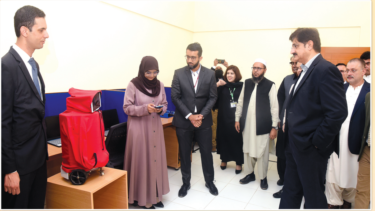
سنڌ جو وڏو وزير سيد مراد علي شاهه ڪورنگي ڪراچي ۾ نئين آتزم ريهيبلٽيشن اينڊ ٽريننگ سينٽر جو دورو ڪري رهيو آهي، ان موقعي تي اطلاعات کاتي جو صوبائي وزير شرجيل انعام ميمڻ پڻ موجود آهي.