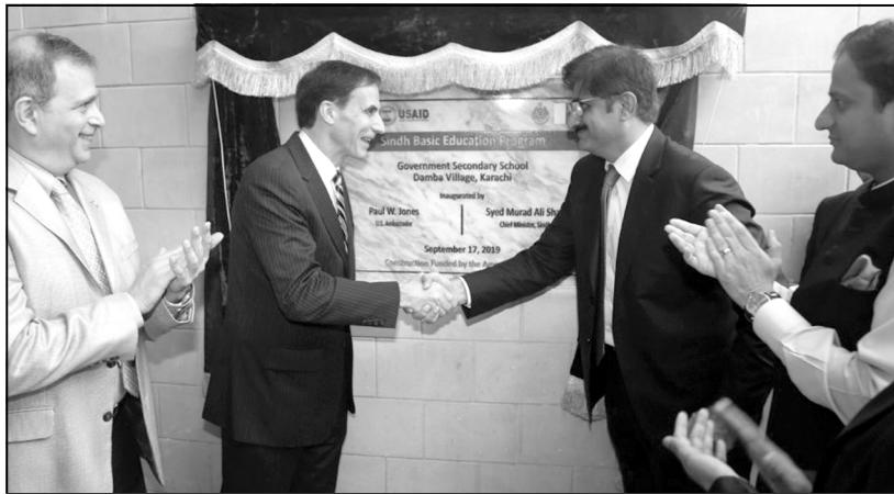
سندھ بیسک ایجوکیشن پروگرام کے تحت ڈمباگوٹھ کراچی میں ایک اسکول کا افتتاح۔