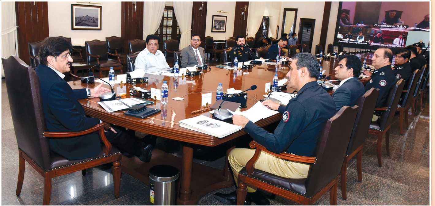
سنڌ جو وڏو وزير سيد مراد علي شاهه، امن امان حوالي سان اجلاس جي صدارت ڪري رهيو آهي، ان موقعي تي آءِ جي سنڌ غلام نبي ميمڻ، ڪمشنر ڪراچي محمد اقبال ميمڻ ۽ ڪراچي پوليس چيف، جاويد عالم اوڍو پڻ موجود آهن.