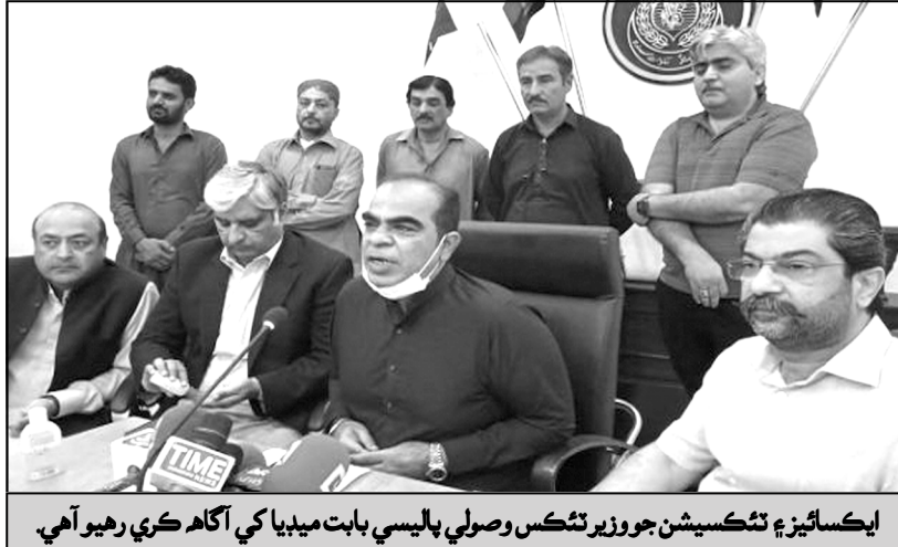
ايڪسائيز ۽ ٽيڪسيشن جو وزير ٽيڪس وصولي پاليسي بابت ميڊيا کي آگاهه ڪري رهيو آهي.

ٽيڪس، استيت ٽيڪس، پراپرٽي ٽيڪس، سيلز ٽيڪس، رول ٽيڪس، ڊيوٽيز ۽ ٽيرف به لڳائين ٿا. معاشي لحاظ کان ٽيڪس امير گهراڻن يا ڪاروبارن سان واڳيل ماڻهن کان حڪومت کي منتقل ٿيندو آهي، جنهن سان اقتداري ترقي يا بهتري وڌي يا گهٽ ٿي سگهجي ٿي. ٽيڪس ذريعي فراهم ٿيندڙ رقم کي حڪومتي ڪارونهيوار هلائڻ لاءِ استعمال ڪيو ويندو آهي، جن مان ڪجهه عوامي تحفظ، تعليم، صحت، سائنسي تحريڪ، ترقي، ثقافتي ۽ ٻين عوامي ڪمن لاءِ استعمال ڪيو ويندو آهي، خرچ ٽيڪس جي آمدني کان وڌيڪ هجن ٿا ته حڪومتون سرڪاري قرض جمع ڪنديون آهن، مطلب ته هر ملڪ ٽيڪس وصوليون ڪندو آهي پوءِ هر ڪنهن جي استعمال جا طريقا پنهنجي