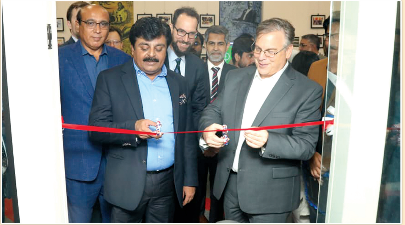
صوبائی وزیر ثقافت و تعلیم سید سردار علی شاہ اور پاکستان میں مقیم امریکہ کے سفیر، لیاقت لائبریری کراچی میں امریکن ٹونسلٹ کراچی کے تعاون سے تعمیر ہونے والے ”اسٹارٹ اپ لیب“ کا افتتاح کر رہے ہیں۔