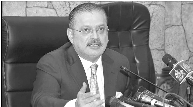
صوبائی وزیر اطلاعات، سرکاری ملازمتوں میں بھرتی پالیسی کے حوالے سے میڈیا نمائندگان کو آگاہ کر رہے ہیں۔

منسلک ہے۔ اگر انسان برسر روزگار نہ ہو گا یا اس کے حصول رزق کے ذرائع متعین نہیں ہوں گے تو وہ معاشی بد حالی کا شکار ہو گا جس کے سبب دیگر کئی مسائل جنم لیں گے اور معاشرے میں بگاڑ پیدا ہو گا۔ لہذا اس بنیادی مسئلے کی طرف توجہ دینے کی اشد ضرورت محسوس کی جاتی ہے۔ ترقی یافتہ معاشرے اس بنیادی انسانی مسئلے پر مسلسل توجہ مرکوز رکھنے اور اس سے نبرد آزما رہنے کی وجہ سے بڑی حد تک اس مسئلے پر قابو پا چکے ہیں اور قوم کی بڑی تعداد کو برسر روزگار یا ملازمتوں کے حصول کے لیے حکمت عملی طے کر چکے ہیں، لہذا وہاں کی نوجوان نسل تعلیم کے حصول کے فوراً بعد کسی نہ کسی شعبے میں اپنی خدمات دیتی نظر آتی ہے، جس کی بدولت بے روزگاری کے مسئلے کا بڑی حد تک تدارک کیا جا چکا ہے، لیکن بد قسمتی ہے ہمارے ملک پاکستان میں ابھی تک اس سلسلے میں کوئی خاطر خواہ کامیابی حاصل