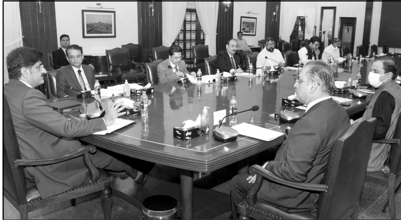
وزیر اعلیٰ سندھ سید مراد علی شاہ، کراچی میں ترقیاتی کاموں کے حوالے سے اجلاس کی صدارت کر رہے ہیں۔

کراچی میں عموماً ایسا دیکھا گیا ہے کہ گلیوں میں زیر زمین پانی یا بجلی کی لائنیں ڈالنے کے