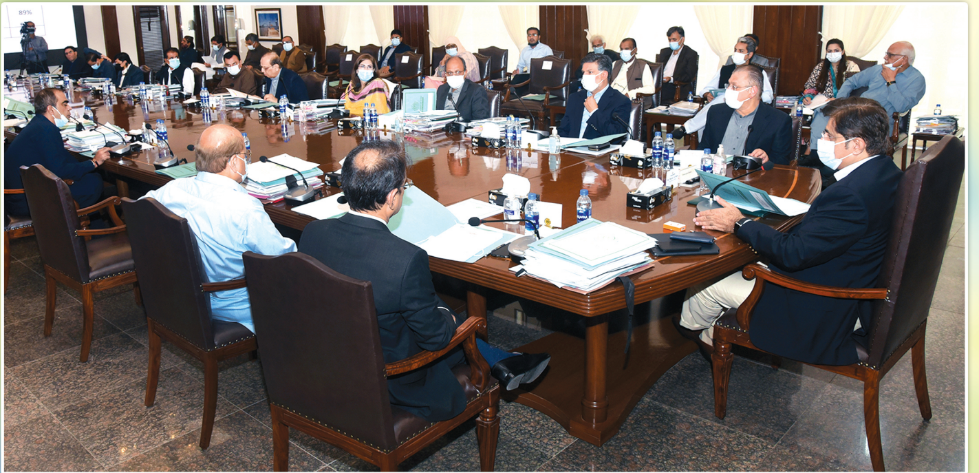
وزیر اعلیٰ سندھ سید مراد علی شاہ، سندھ کابینہ کے اجلاس کی صدارت کر رہے ہیں۔