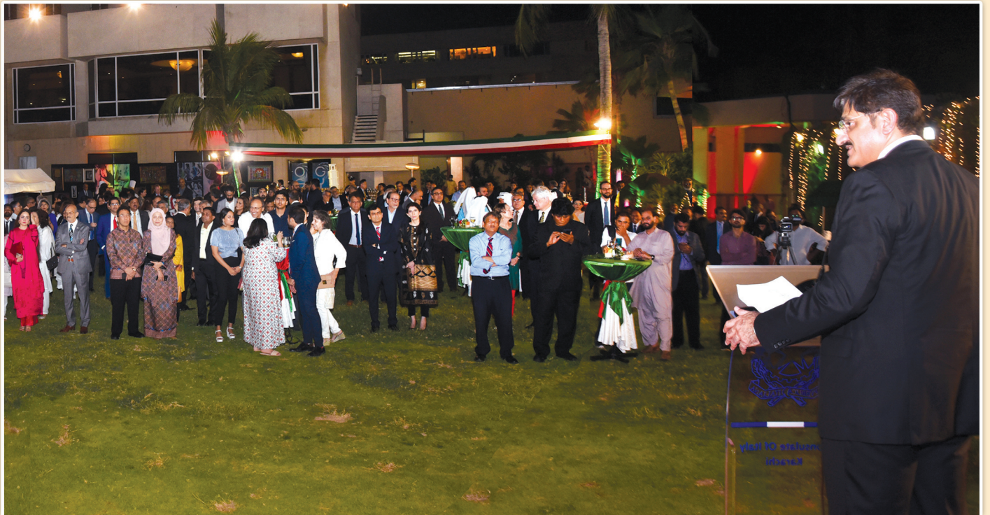
سنڌ جو وڏو وزير سيد مراد علي شاهه، اتلي جي قونصل جنرل ڊينيلو گيارڊينيل طرفان ڏنل دعوت ۾ اتلي جي اهم ڏينهن حوالي سان تقريب ۾ خطاب ڪري رهيو آهي.