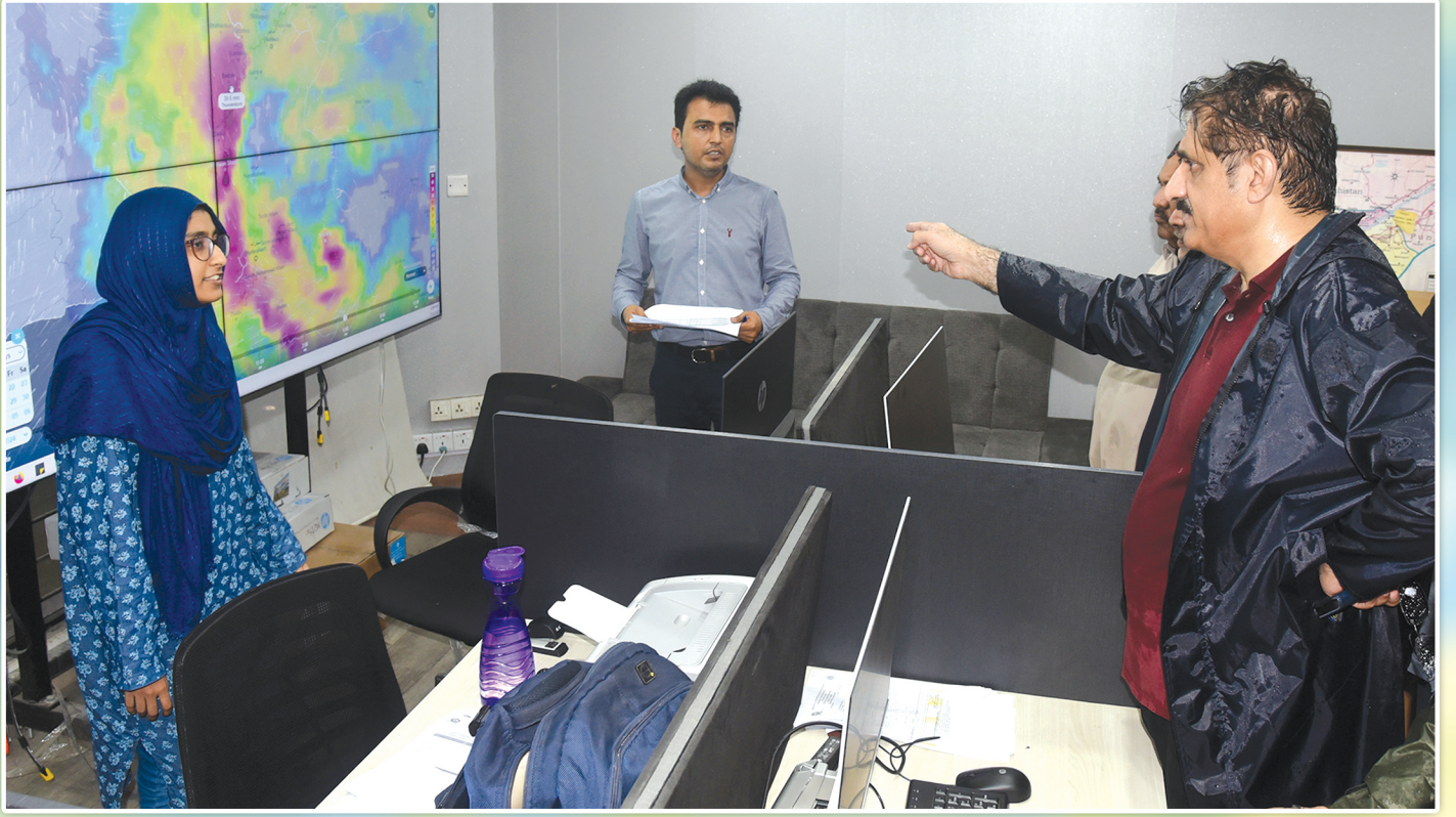
وزیر اعلیٰ سندھ سید مراد علی شاہ، صوبائی ڈیزاسٹر مینجمنٹ اتھارٹی کے دفتر میں بارش کے حوالے سے معلومات حاصل کر رہے ہیں۔