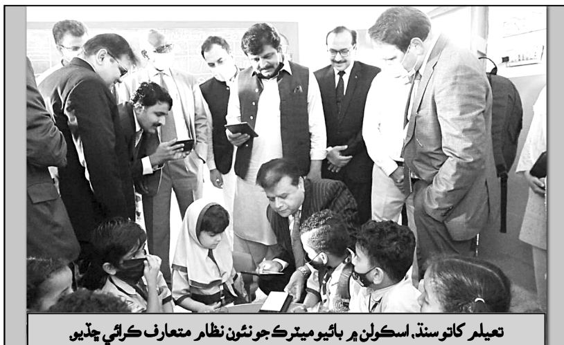
تعليم کاتو سنڌ، اسڪولن ۾ بايو ميٽرڪ جون نئون نظام متعارف ڪرائي ڇڏيو

طور بيان ڪيو ويندو آهي. حقيقت ۾ اسان مان ڪيترائي هاڻ اسان جي بايو ميٽرڪ جي استعمال سان اسان جي آڱرين جي نشان ۽ اسان جي چهری جي استعمال ۾ آهي. بايو ميٽرڪ جو نظام ڪيترائي ڏهاڪا پهريان مختلف صنعتن جي استعمال هيٺ رهيو آهي، جديد ٽيڪ ان کان وڌيڪ عوامي سڃاڳي حاصل ڪرڻ ۾ مدد لاءِ ان جو استعمال شروع ڪيو آهي. مثال طور اسمارٽ فونز کي ان لاءِ ڪرڻ لاءِ فننگر پرنٽ اسڪينرز يا چهری جي سڃاڻپ جي سهولت فراهم ڪري ٿو. بايو ميٽرڪ انساني خاصیتن کي پاڻ وٽ محفوظ ڪندو آهي، هي خاصیتون ماڻهن جون هڪٻئي کان مختلف هونديون آهن. بايو ميٽرڪ علامتون هيڪ، چوري يا جعلی ڪرڻ لاءِ تمام گهڻو مشڪل هوندو آهي، انڪري هاڻ هن جو استعمال