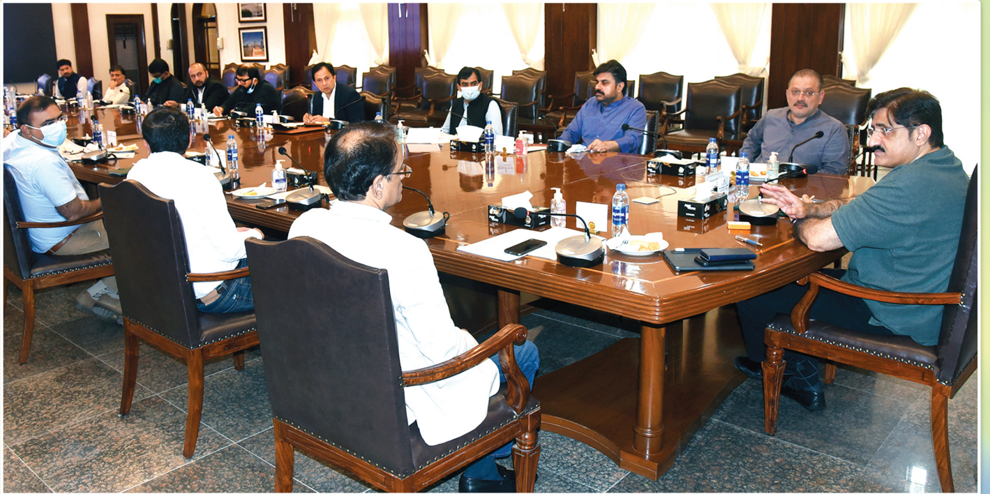
سنڌ جو وڏو وزير سيد مراد علي شاهه، مڪاني ادارن ۽ ٽرانسپورٽ کاتي جي گڏيل اجلاس جي صدارت ڪري رهيو آهي، ان موقعي تي صوبائي وزير شرجيل انعام ميمڻ، سيد ناصر حسين شاهه ۽ چيف سيڪريٽري ڊاڪٽر محمد سهيل راجپوت پڻ موجود آهن.